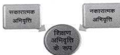
चित्र संख्या 01-शिक्षण अभिवृत्ति के रूप

शिक्षण-अधिगम प्रक्रिया की सफलता शिक्षण के प्रति शिक्षक की अभिवृत्ति पर निर्भर करती है। यदि शिक्षण के प्रति शिक्षक की अभिवृत्ति सकारात्मक है तो शिक्षण-अधिगम प्रक्रिया अपने उद्देश्यों को सफलतापूर्वक प्राप्त कर लेगी, इसके विपरीत यदि शिक्षण के प्रति शिक्षक की अभिवृत्ति नकारात्मक है तो शिक्षण-अधिगम प्रक्रिया असफल हो जाएगी तथा अपने उद्देश्यों को सफलतापूर्वक प्राप्त नहीं कर पायेगी।