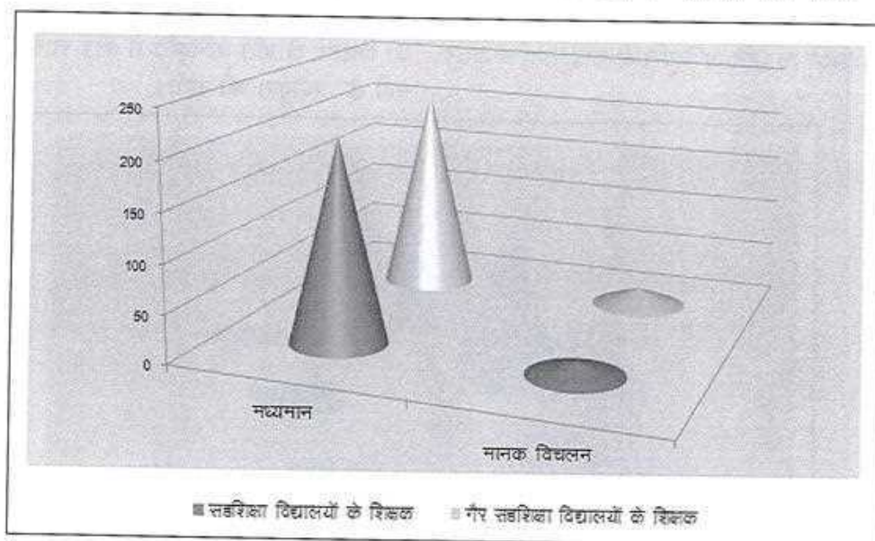
चित्र संख्या 04—बरेली जनपद के सहशिक्षा व गैर सहशिक्षा विद्यालयों में कार्यरत शिक्षकों की शिक्षण के प्रति अभिवृत्ति

पर अध्ययन की परिकल्पना “बरेली जनपद के सहशिक्षा व गैर सहशिक्षा विद्यालयों में कार्यरत शिक्षकों की शिक्षण के प्रति अभिवृत्ति में कोई सार्थक अंतर नहीं है” स्वीकृत की गयी।