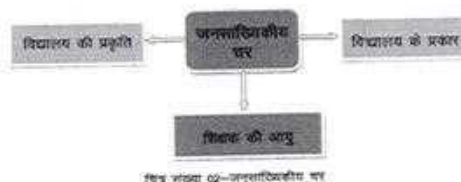
चित्र संख्या 02-जनसांख्यिकीय चर

उक्त लघु शोध में जनसांख्यिकीय चर से अभिप्राय चुने हुए विभिन्न चरों (विद्यालय की प्रकृति, विद्यालय के प्रकार व शिक्षक की आयु) के आधार पर जनसंख्या (बरेली जनपद के विभिन्न प्राथमिक एवं माध्यमिक विद्यालयों में कार्यरत शिक्षक) के सांख्यिकीय अध्ययन से है।